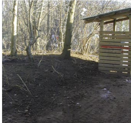
15 minutter senere - klappet og klart.

Første gang vi begyndte at tale om bolignet, var det uløseligt forbundet med helhedsløsningen. Vi kunne ikke få lov at sætte noget i gang uden om helhedsløsningen, selvom vi ret hurtigt var klar over, at de to ting ikke var betinget af hinanden. Og i dag kan vi kun være glade for, at bindingen blev opgivet. Byggeriet i forbindelse med helhedsløsningen kommer ikke i gang i 2005, som skal bruges til detail-projektering, lokalplan, skema A-behandling og senere licitation. Focusgrupperne skal indkaldes for at komme med input til detailplanlægningen her i foråret.