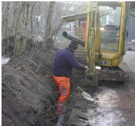
Der arbejdes ihærdigt med nedgravning af kabler.

Efter det der føles som mange års forarbejde, er der nu kun fire måneder til, at vi kan sætte strøm på. Lige nu er det svært at finde noget, der kan vælte tidsplanen. En streng frostvinter er der vist ingen, der forventer, her hvor vi har passeret kyndelmisse (lysmesse for Jomfru Maria d. 2. februar, red.) – og det ville sikkert ikke betyde noget alligevel. Ncore-folkene er begyndt inde i lejlighederne nu. Den generelle orienterings-skrivelse er kommet ud, og flere følger.