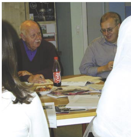
Debatten var ivrigt på tværs af generationer og kultur.