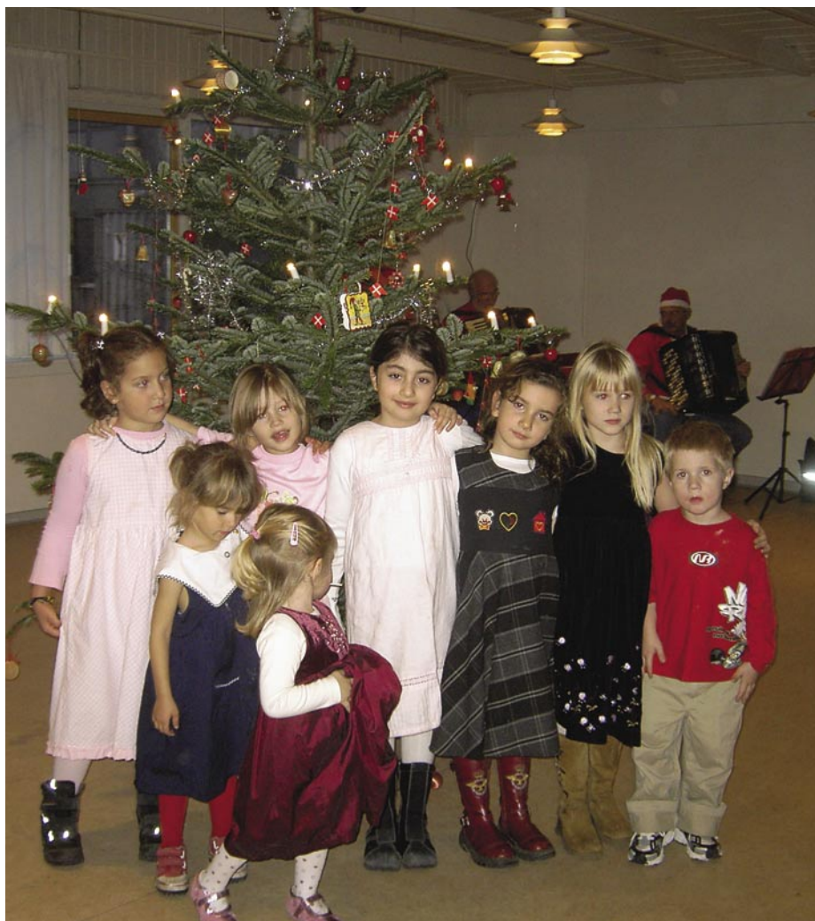
Sidste års julefest i beboerhuset i Damgården.

En adventskrans er fire lys, som bliver tændt et ad gangen de fire sidste søndage før jul ■