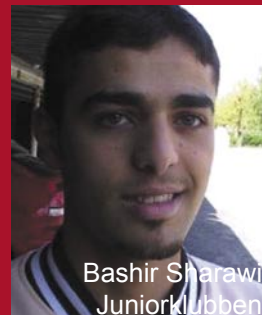
Bashir Sharawi Juniorklubben